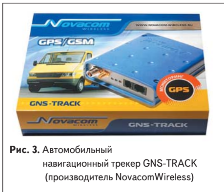
Рис. 3. Автомобильный навигационный трекер GNS-TRACK (производитель NovacomWireless)

В настоящее время особо актуален вопрос рационального расходования топлива, поэтому многие заказчики стремятся оснастить свои автомобили устройствами соответствующего контроля. Прибор GNS-GLONASS обладает