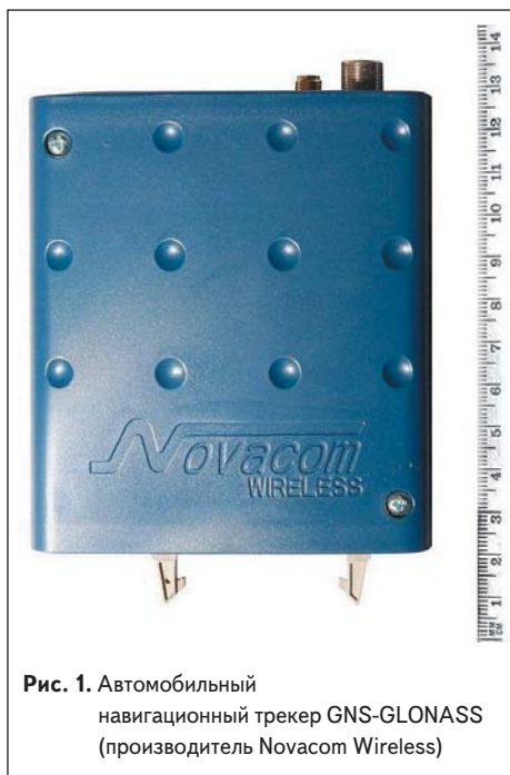
Рис. 1. Автомобильный навигационный трекер GNS-GLONASS (производитель Novacom Wireless)