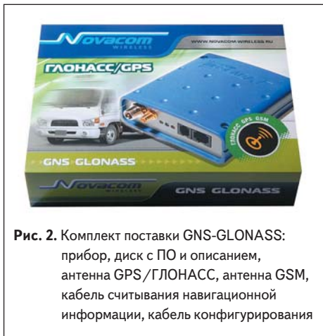
Рис. 2. Комплект поставки GNS-GLONASS: прибор, диск с ПО и описанием, антенна GPS/ГЛОНАСС, антенна GSM, кабель считывания навигационной информации, кабель конфигурирования

никационных устройств. Выносные антенны прибора должны быть расположены в местах, обеспечивающих нормальный прием радиосигналов. В условиях сильного сигнала GSM соответствующая антенна может быть установлена достаточно «свободно», но в условиях слабого сигнала GSM ее следует позиционировать с соблюдением всех условий, обеспечивающих хорошую связь. Антенна ГЛОНАСС должна быть расположена в соответствующем месте и соответствующим образом ориентирована, чтобы обеспечить максимально высокое качество приема радиосигналов от спутников, в том числе в условиях работы любого оборудования автомобиля.