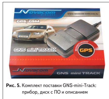
Рис. 5. Комплект поставки GNS-mini-Track: прибор, диск с ПО и описанием

Прибор контролирует входное напряжение и напряжение на встроенном аккумуляторе. Встроенный стандартный аккумулятор обеспечивает работу в режиме GPS + GPRS не менее 5 часов при полном заряде (типичное — 8 часов), морозостойкий аккумулятор — 3 (5) часов. При работе без передачи (только GPS) это время составляет 24 (36) часов и 16 (20) часов для стандартного и морозостойкого аккумуляторов соответственно.