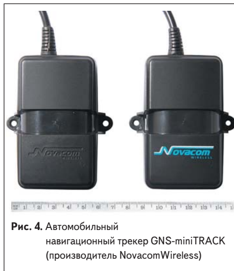
Рис. 4. Автомобильный навигационный трекер GNS-miniTRACK (производитель NovacomWireless)

Устройство GNS-miniTRACK выполнено в виде моноблока, имеет брызгозащищенный пластиковый корпус и подводящий кабель с уплотнителем. На верхней панели корпуса расположен иллюминатор для возможности наблюдения за световыми индикаторами работы прибора. Оборудование имеет современный экономичный приемник GPS-сигнала. Антенны GPS и GSM встроенные, поэтому простейший вариант установки прибора — расположение его под лобовым стеклом автомобиля (в случае питания прибора от встроенного аккумулятора). В более сложном случае требуется подсоединение